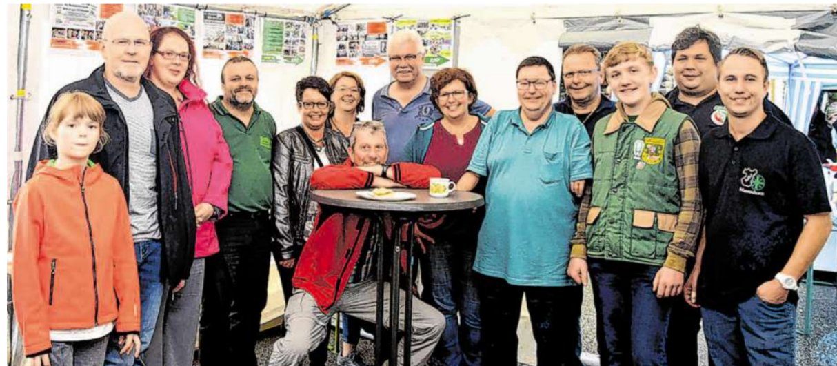
Ließen sich beim 30. Geburtstag des BdSJ vom Regen beim Wandern, Menschen-Kicker-Turnier und Feiern in geselliger Runde die Laune nicht verderben: die Schützen des Monschauer Landes.